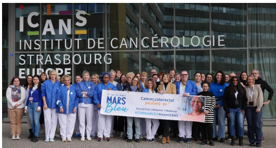
Les équipes de l'ICANS se mobilisent pour le lancement de la campagne #ICANSenBLEU

Dans le cadre de Mars Bleu, campagne nationale de prévention du cancer colorectal, l'ICANS se mobilise pour sensibiliser sur l'importance du dépistage des cancers colorectaux. Tout au long du mois des actions seront proposées pour informer sur le cancer colorectal et les modes de vie à adopter, pour partager l'expertise et l'expérience des patients, et pour permettre à chacun d'échanger avec des professionnels de santé et des associations.