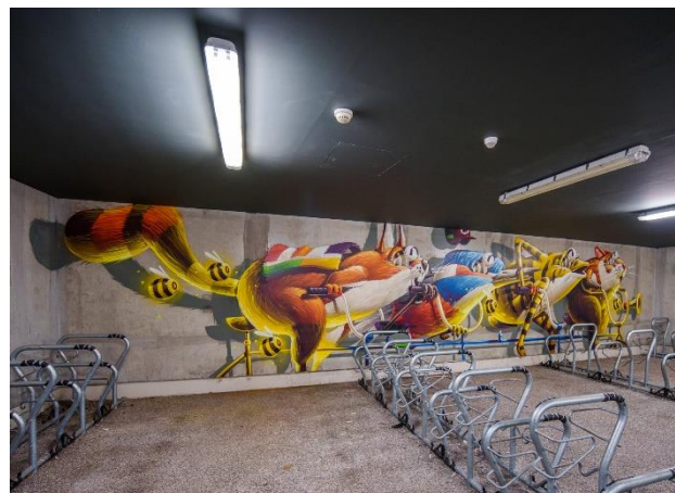
Stom500 – En avant !