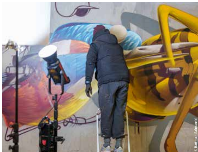
Le local à vélos | Pendant