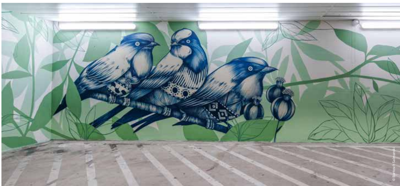
Le dépose-minute VSL / Ambulances | Après