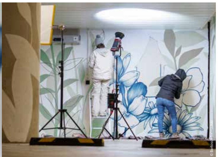
Le dépose-minute VSL / Ambulances | Pendant