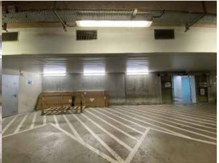
Le dépose-minute VSL / Ambulances | Avant